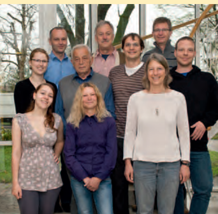
Die Arbeitsgruppe „Streuobst und Öffentlichkeitsarbeit“

Streuobstwiesen sind aus unserer Kulturlandschaft nicht wegzudenken. Sie liefern seit Jahrhunderten Obst, betten unsere Gehöfte und Dörfer harmonisch in die umgebende Landschaft ein und bieten dem Vieh Schutz bei Sonne und Regen. Nicht zuletzt finden mehrere 1000 Tier- und Pflanzenarten in den herrlichen, landschaftsprägenden Obstgärten wertvolle Lebensräume.