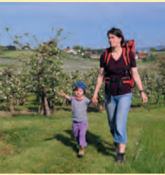
Auf der Wanderung im Hinterland von Wasserburg spaziert man an zahlreichen Niederstammanlagen vorbei.

Wirtschaftliche Zwänge haben in der Landwirtschaft in den letzten Jahrzehnten zu einem massiven Strukturwandel geführt. Das lässt sich gut entlang dieses aussichtsreichen Streuobstwanderweges im Hinterland des Bodensees beobachten. Viele Betriebe haben sich hier auf intensiv genutzte Obstbaukulturen spezialisiert. Die Niederstämme in den Obstplantagen liefern zwar hohe Erträge, bedürfen aber auch einer intensiven Pflege. Für Streuobstbestände, die mit ihren hochstämmigen und großwüchsigen Bäumen viel Platz brauchen, bleibt hier nur noch wenig Raum. Dennoch führt der Weg immer wieder an einzelnen, alten Baumveteranen vorbei, die erahnen lassen, wie die Wiesen hier in früheren Zeiten genutzt wurden.