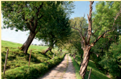
Die Streuobstwiesen in Gestratz-Altensberg beherbergen viele alte robuste Bäume, aber auch Totholz und junge Bäume säumen den Weg.

Der Herbst zeigt sich dann als Jahreszeit der Fülle: In manchen Jahren biegen sich die Äste unter der Last der reifen Äpfel, Birnen und Zwetschgen. In den Streuobstwiesen wird emsig gearbeitet und die Obstbauern bringen mit ihren Helfern die reiche Ernte ein. Bevor die kalte Jahreszeit beginnt, bereiten uns die Hochstämme noch ein besonderes Farbenspiel. Ihre Blätter verfärben sich in den schönsten Farben. Schließlich fällt das welke Laub zu Boden und die Obstgärten fallen in einen tiefen Winterschlaf.